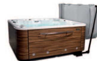
Accessoire idéal pour ramasser en toute commodité la couverture de votre Spa.