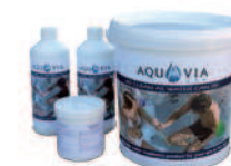
Kit de désinfection